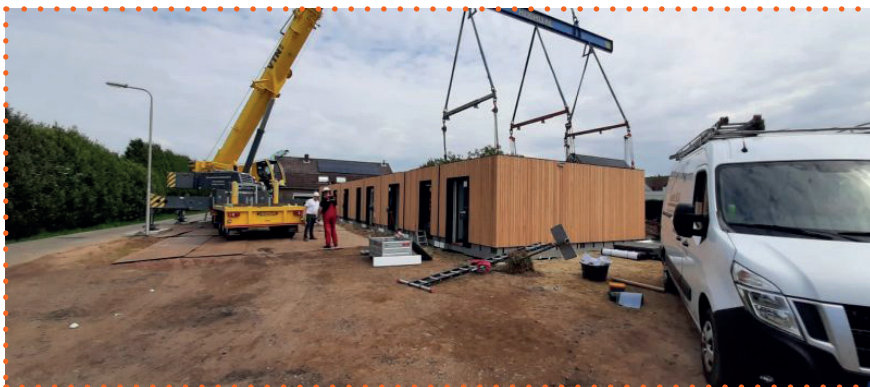
De plaatsing van de woning in slechts 5 uur