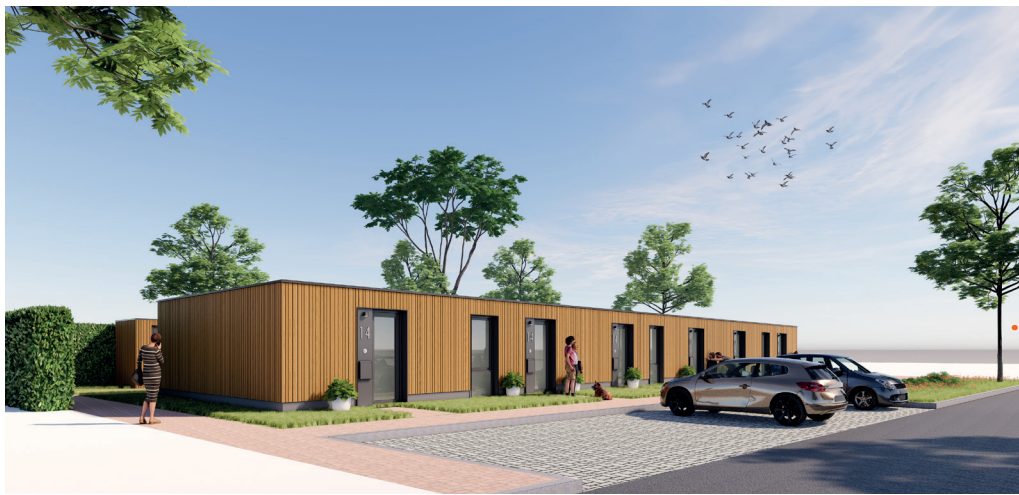
Artist impression woningen Klein Baal