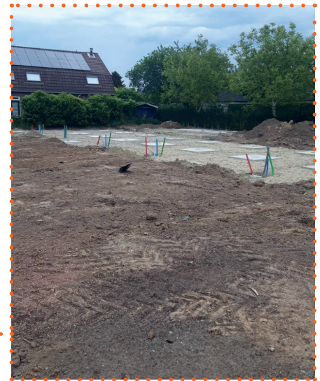
Eerste werkzaamheden op locatie