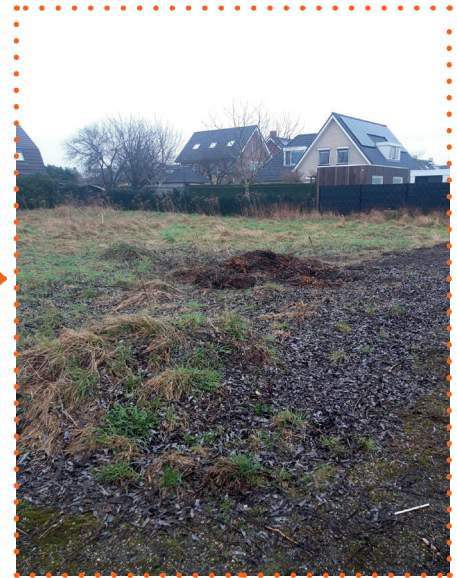
De locatie van de flexibele woningen