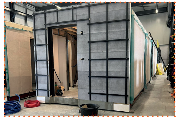
Bouw van de woning in de fabriek